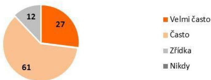
Jak často přihlížíte ve struktuře výuky k aktuálním událostem? (Údaje v %)